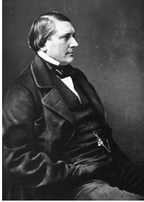
Labiche photographié par Nadar © droits réservés