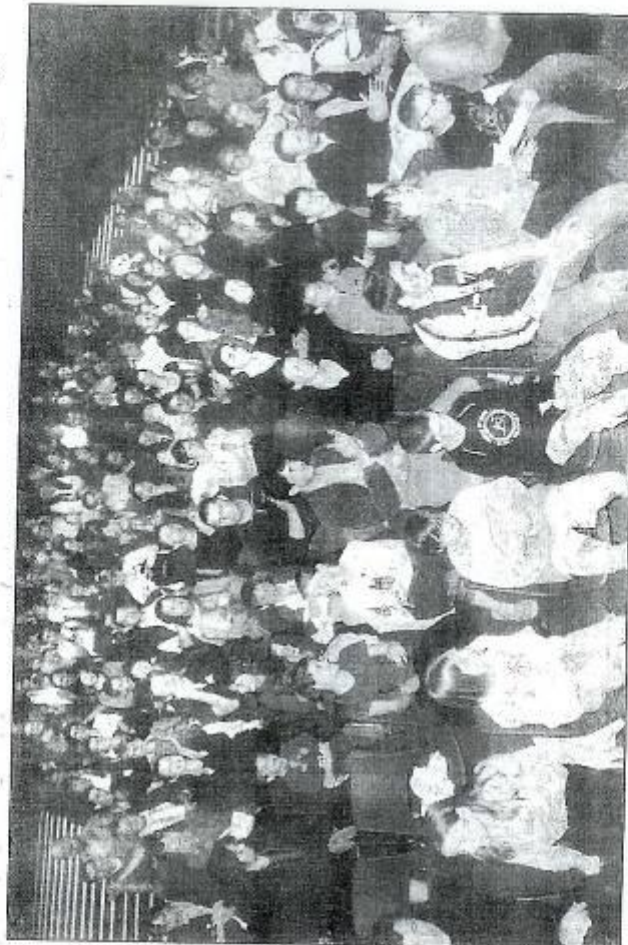
Public ravi pour une soirée de clôture qui en annonce bien d'autres compte tenu du succès remporté par le festival.

Invitée surprise de cette soirée de clôture, « l'Escobelle » a ensuite glacé le public avant que le groupe Le-